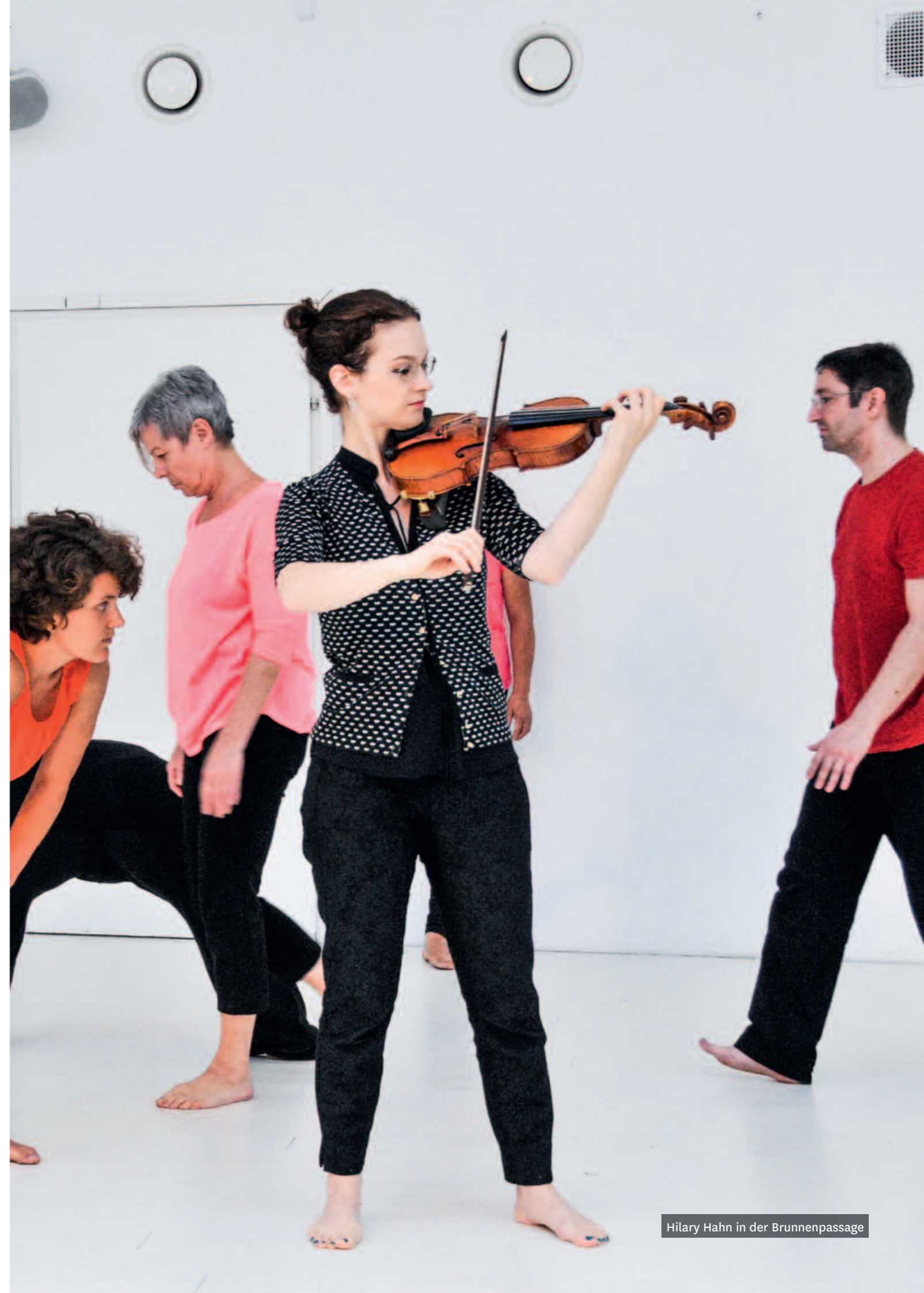
Hilary Hahn in der Brunnenpassage

Österreich | Thomas Hampson & The Philharmonics, 16. 2. 2016