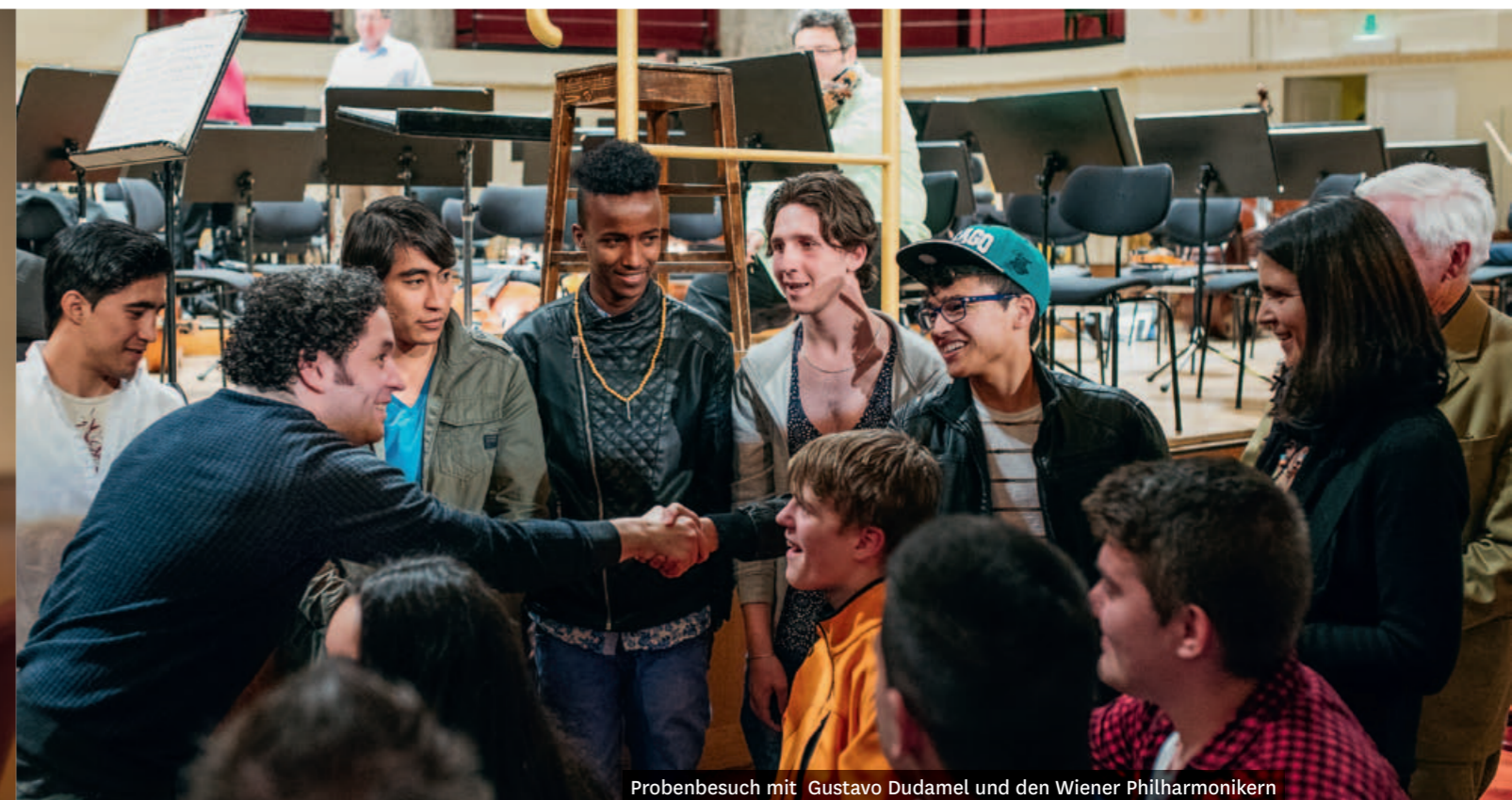
Probenbesuch mit Gustavo Dudamel und den Wiener Philharmonikern