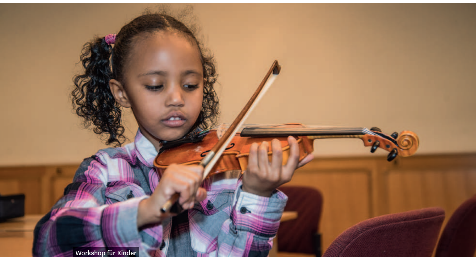
Workshop für Kinder

Um die Relevanz des künstlerischen Angebots im Wiener Konzerthaus für verschiedenste Zielgruppen weiter zu stärken, wird das Vermittlungsangebot auch in der Saison 2016/17 vor allem für jugendliches Publikum und junge Erwachsene weiter ausgebaut.