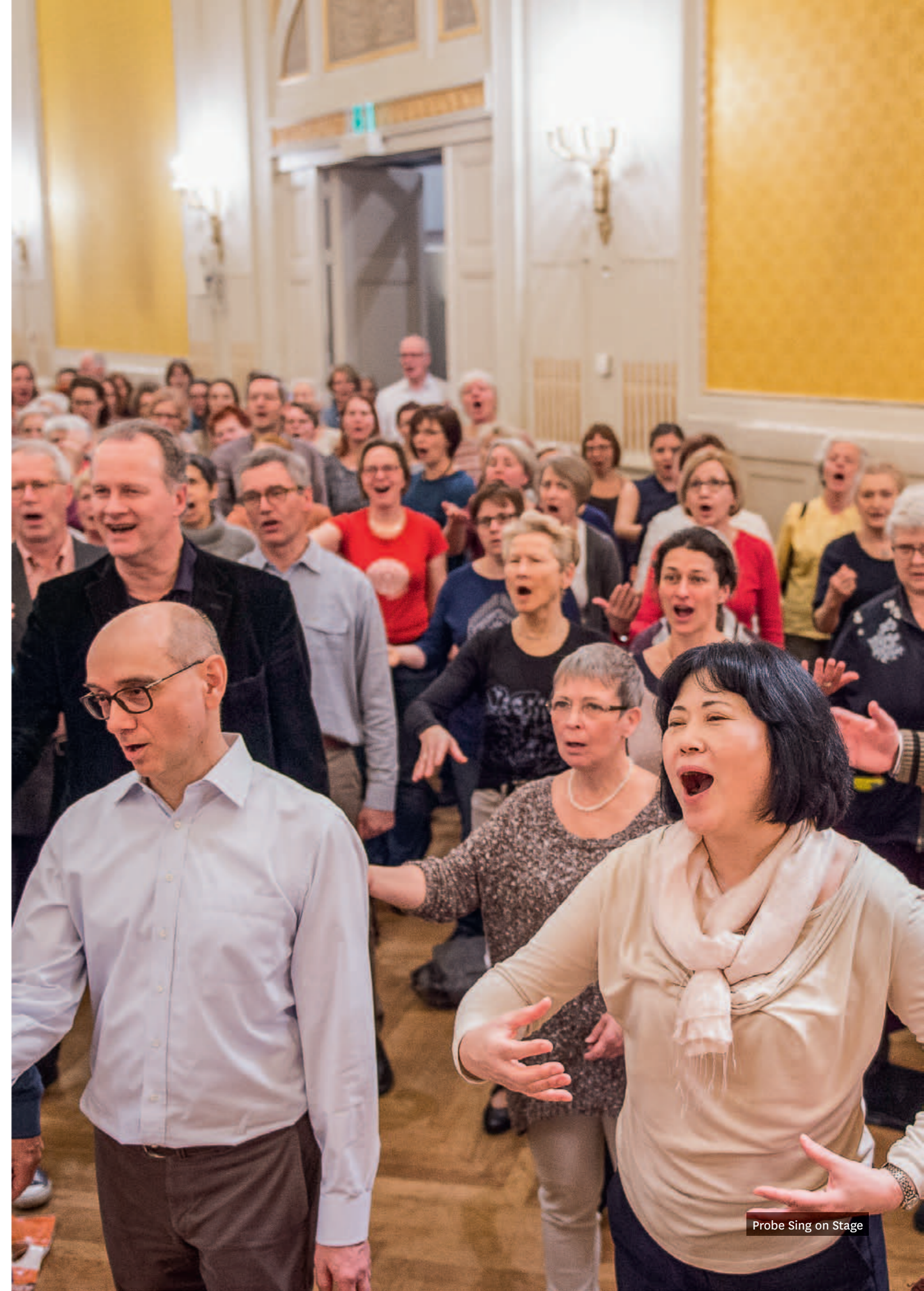
Probe Sing on Stage