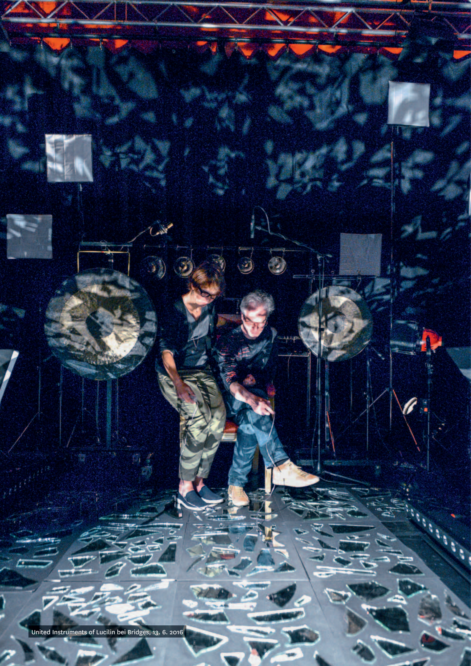
United Instruments of Lucilin bei Bridges, 13. 6. 2016