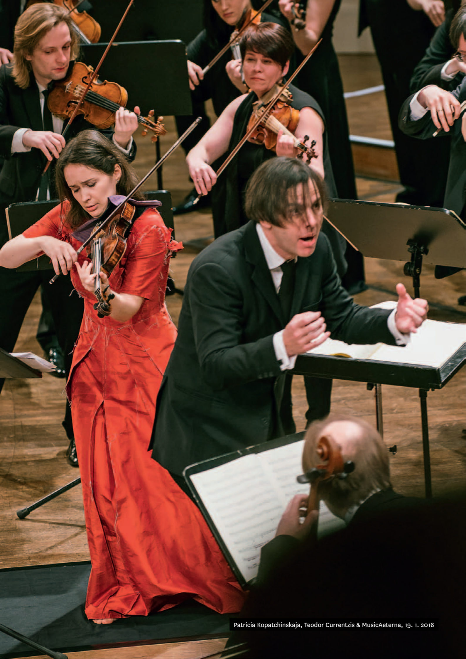
Patricia Kopatchinskaja, Teodor Currentzis & MusicAeterna, 19. 1. 2016