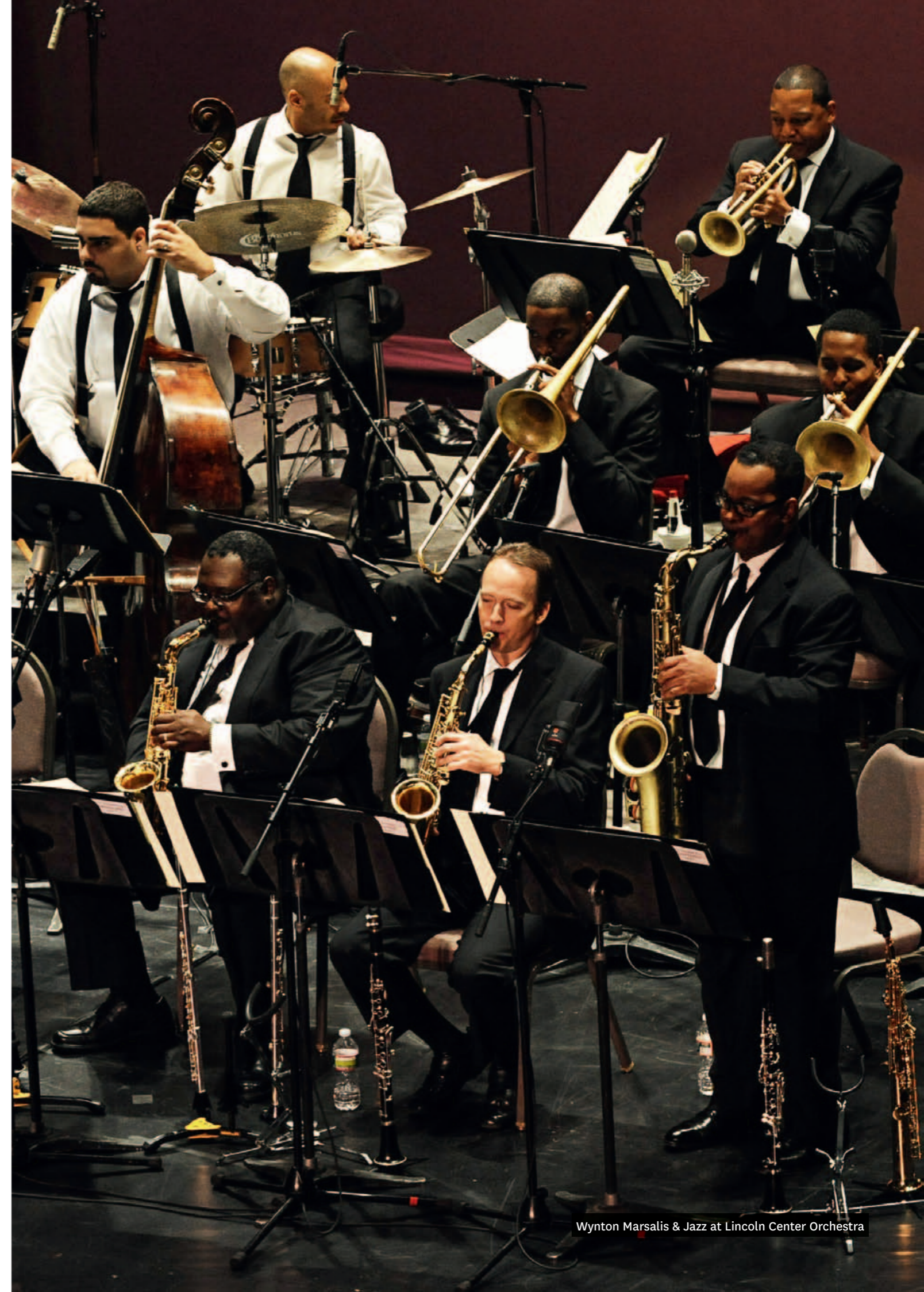
Wynton Marsalis & Jazz at Lincoln Center Orchestra